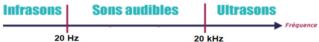
Figure 3 – Domaine de fréquences sonores pour l'oreille humaine.

Des avions bombardiers d'eau sont utilisés pour éteindre les feux de forêts. Pour remplir son réservoir d'eau, l'avion doit effleurer un plan d'eau ( figure 4 ).