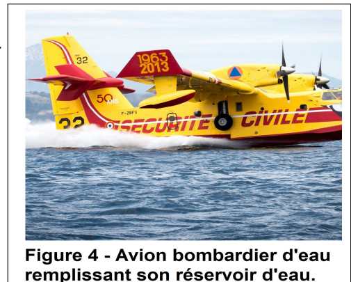
Figure 4 - Avion bombardier d'eau remplissant son réservoir d'eau.

Il sera tenu compte de la rédaction et de la présentation des calculs. Toute démarche sera valorisée.